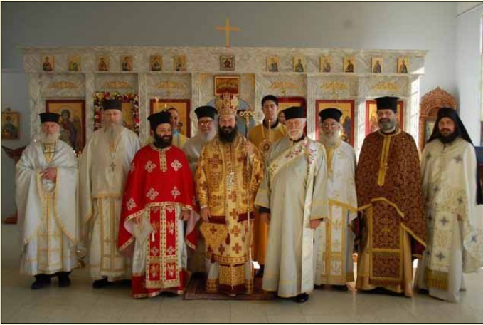
άρκετών Κληρικών και Όρθοδόξων πιστών της έν Άμερικη Έκκλησίας μας.