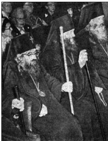
Ὁ Ἀρχιεπίσκοπος Λεόντιος (στό μέσον) πλησίον τοῦ Ἁγίου Ἰωάννου Μαξίμοβιτς σέ δίκη τοῦ τελευταίου τὸ 1963

Θαυματοργὸ Ἀρχιεπίσκοπο Σαν Φρανσίσκο Ἅγιο Ἰωάννη Μαξίμοβιτς, στὸν ὁποῖο συμπαραστάθηκε σὲ ὅλες τὶς δύσκολες στιγμὲς του.