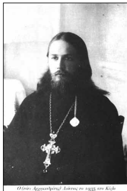
Οἱ ἅγιοι Ἀρχιεπίσκοποι Λεόντιος το 1943 στὴν Κιέβη

Γιὰ παραπάνω ἀπὸ μία πενταετία ὁ Λεόντιος ἔζησε, ὡς μέλος τῆς Ἐκκλησίας τῶν Κατακομβῶν, σὲ παράνομη κατάσταση κρυπτόμενος ἀπὸ τοὺς διώκτες του, σὲ διάφορες περιοχές. Τὸ 1941, μὲ τὴν κατοχὴ τοῦ Ζιτόμιρ ἀπὸ τὰ γερμανικὰ στρατεύματα, οἱ διωγμοὶ τῶν Χριστιανῶν ἔπαυσαν καὶ ἡ Ἐκκλησία ἀναδιοργανώθηκε. Οἱ ἐναπομείναντες διασωθέντες Κληρικοὶ ἐξέλεξαν παμφηφεὶ τὸν Λεόντιο γιὰ τὴν Ἐπαρχία Βολίνσκαγια καὶ στίς 14 Νοεμβρίου 1941 χειροτονήθηκε Ἐπίσκοπος Ζιτόμιρ ἀπὸ τοὺς Ἀρχιερεῖς τῆς Ὀρθοδόξου Αὐτόνομης Οὐκρανικῆς Ἐκκλησίας 2 . Ἡ ἐν λόγῳ Αὐτόνομη Ἐκκλησία, ἡ ὁποία δημιουργήθηκε μὲ βάση παλαιότερο σχετικὸ Διάταγμα τοῦ Πατριάρχου Μόσχας Ἁγίου Τύχωνος, ἂν καὶ θεωρητικὰ ἀποτελοῦσε μέρος τοῦ Πατριαρχείου Μόσχας, οὐσιαστικὰ δὲν εἶχε ἐκκλησιαστικὴ κοινωνία μαζί του ἐξαιτίας τοῦ Σεργιανισμού ἀπὸ τὴν μία (ἄλλωστε ἡ συντριπτικὴ πλειοψηφία τῶν μελῶν της,