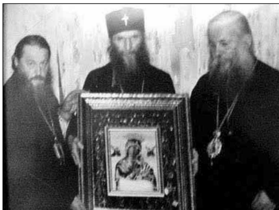
Ἀριστερά ὁ Ἀρχιεπίσκοπος Λεόντιος, στὸ μέσον ὁ Ἅγιος Φιλάρετος καὶ δεξιὰ ὁ Ἐπίσκοπος Ἀστορίας Πέτρος Ἀστυφίδης.

μοιράστηκε στὴν κηδεία τους, παρουσιάστηκε ἀπὸ τοὺς συκοφάντες ὡς ἐπίσημη συμπροσευχὴ μεθ' ἑτεροδόξων καὶ τὸ ἐνημερωτικὸ φυλλάδιο ὡς λειτουργικὸ βιβλίο τῶν Λατίνων! Ἡ προπαγάνδα τῶν ἐχθρῶν τῆς Ἐκκλησίας μας δὲν κόπασε οὔτε καὶ ὅταν μὲ ἐπιστολὲς τοῦ ὁ Ἀρχιεπίσκοπος Λεόντιος ἀποκάλυψε ἀκριβῶς τι εἶχε συμβεῖ καὶ ἔτσι μέχρι σήμερα παραμένει ἡ σκιά αὐτὴ στὸ πρόσωπό του, ἀφοῦ τὰ ἔντυπα τῶν Παρασυναγωγῶν καὶ τῶν Καινοτόμων, δὲν τόλμησαν νὰ ἀνακαλέσουν τὶς συκοφαντίες τους.