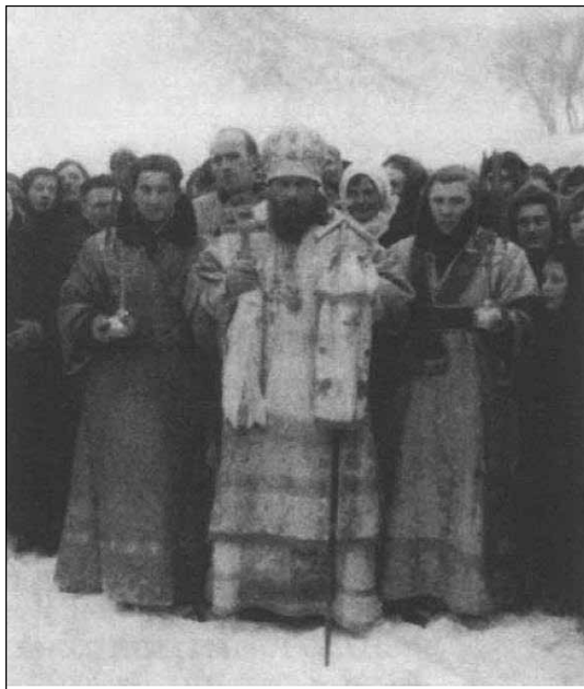
Ὁ (τότε) Ἐπίσκοπος Ζιτόμιρ) Λεόντιος μὲ τὸ ποίμνός του, ἀρχὴς τῆς δεκαετίας τοῦ '40

Ὁ Λεόντιος ποίμανε θεοφιλῶς τὴν Ἐπισκοπὴ του ἐπιναλειτουργῶντας τριακόσιες Ἐνορίες καὶ χειροτονῶντας ἑκατὸ Ἱερεῖς, τοὺς ὁποίους ἐκπαίδευσε θεολογικά. Δυστυχῶς μὲ τὴν ἐπανακατάληψη τοῦ Ζιτόμιρ ἀπὸ τὰ σοβιετικὰ στρατεύματα τὸ 1943 ἡ Ἐκκλησία ἐπανῆλθε σὲ