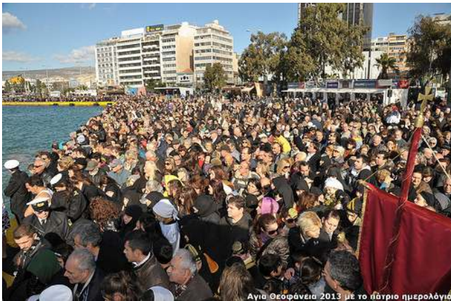
Αγία Θεοφάνεια 2013 με το πατρίο ημερολόγιο

Π αρά τὰς προβλέψεις τῆς μετεωρολογικῆς ὑπηρεσίας περὶ βροχοπτώσεων εἰς τὸν Πειραιᾶ κατὰ τὴν ἑορτὴν τῶν Ἁγίων Θεοφανείων, ἡ πρωΐα τοῦ Σαββάτου 6/19 Ἰανουαρίου ὑπῆρξε ἠλιόλουστος καὶ τοῦτο ἔδωσε τὴν εὐκαιρίαν εἰς χιλιάδας εὐσεβῶν γνησίων Ὀρθοδόξων Χριστιανῶν νὰ διατρανώσουν τὴν προσήλωσίν των εἰς τὰς πατρῶας παραδόσεις εἰς τὸν πρῶτον λιμένα τῆς χώρας.