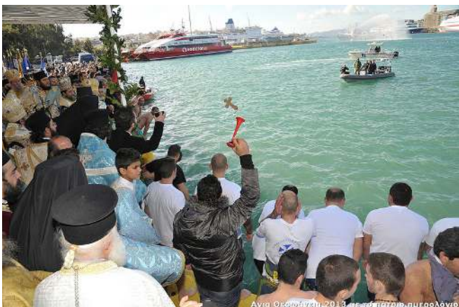
Αγία Θεοφάνεια 2013 με το πατρίο ημερολόγιο

Ἡ μεγαλοπρεπὴς λιτανευτικὴ πομπὴ ἐπορευθῆ, συνοδεῖα 6 φιλαρμονικῶν, ἐκ τοῦ Ἱεροῦ Ναοῦ Ἁγίου Ἀποστόλου Φιλίππου Καμινίων εἰς τὴν ἠντρεπισμένην ἐξέδραν, ὅπου ὡς συνήθως ἐγένετο δεκτὴ ὑπὸ τῆς ἀναμενούσης φιλαρμονικῆς τοῦ Λιμενικοῦ σώματος.