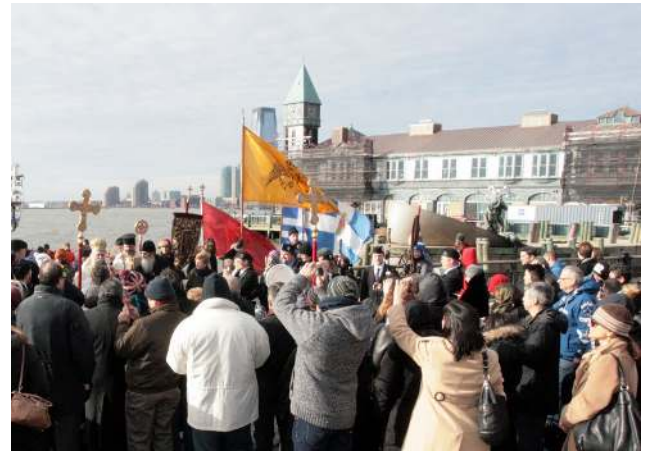
(Ἐπάνω & κάτω, Κατάδυσις Τ. Σταυροῦ εἰς τὸν Λιμένα τῆς Νέας Ὑόρκης)

Τὰ Θεοφάνεια ἐορτάσθησαν λαμπρῶς ἐπίσης ἐν Θεσσαλονίκῃ, Χαλκίδι, καὶ Νέα Ὑόρκῃ ὑπὸ τῶν οἰκείων Ἱεραρχῶν καθὼς καὶ ὑπὸ τῶν κατὰ τόπους Ἐφημερίων εἰς τὰς ὑπολοίπους περιοχάς.