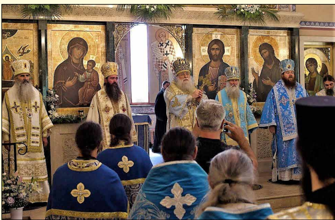
κ. Φώτιο και τόν Θεοφ. Ἐπίσκοπο Νικοπόλεως κ. Βίκτωρα. Ἐπίσῃς, ἔλαβαν μέρος και οἱ Θεοφ. Ἐπίσκοποι Πλοεστίου κ. Ἀντώνιος ἀπό τήν Ρουμανία και Βεσσαραβίας κ. Ἀνθιμος ἀπό τήν Δημ. Μολδαβίας τῆς ΡΟΕΔ.