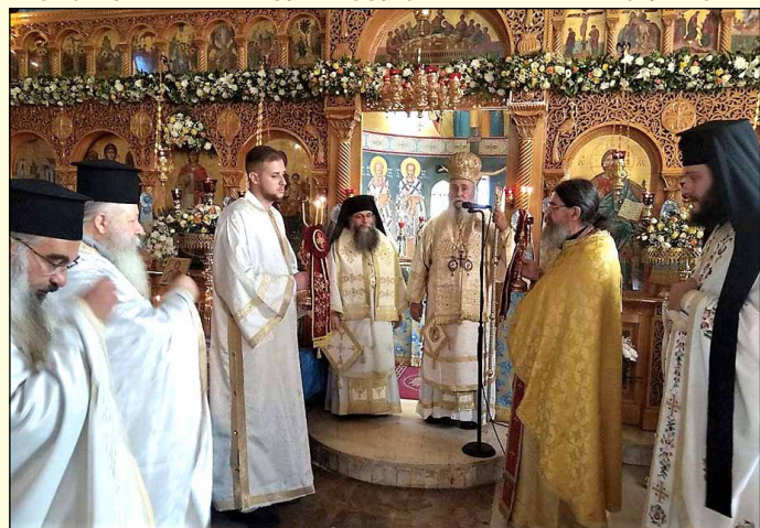
ξάρχοντος τοῦ Μακαριωτάτου Ἀρχιεπισκόπου κ. Καλλίνικου μὲ τὴν συμμετοχὴ τοῦ Σεβ. Μητροπολίτου Δημητριάδος κ. Φωτίου, ἐκφωνήσαντος ἐόρτιο λόγο, και τεσσάρων Ἱερέων, παρουσία πυκνοῦ ἐκκλησιάσματος.

Στὴν Γλυφάδα πανηγύρισε ὁ Ἱερός Ναός Ἁγίου Φανουρίου τὴν Δευτέρα, 27-8/9-9-2019. Στόν Μέγα Ἑσπερινό τῆς παραμονῆς χοροστάτησε ὁ Σεβασμ. Μητροπολίτης Πειραιῶς και Σαλαμίνας κ. Γερόντιος, ἐνῶ στὴν ἐπακολουθήσασα Λιτανεῖα προεξῆρχε ὁ Μακαριώτατος Ἀρχιεπίσκοπος Ἀθηνῶν και πάσης Ἑλλάδος κ. Καλλίνικος συμπαραστατούμενος ὑπὸ τοῦ Σεβ. κ. Γεροντίου και πλειάδος Ἱερέων. Τούς ἱερούς ὕμνους ἀπέδωσε ἡ Χορωδία τῆς Μητροπόλεως Πειραιῶς ὑπὸ τὴν διεύθυνση τοῦ κ. Ἀθανασίου Ἰωαννίδη ὁμοῦ μετὰ τῶν ἱεροψαλτῶν τοῦ Ναοῦ, τὴν δὲ Ἱερά Εἰκόνα τοῦ Ἁγίου πλαίσισαν νέοι και νεανίδες ἐνδεδυμένοι μετῆς παραδοσιακές ἐθνικές ἐνδυμασίες. Ἀνήμερα ἐτελέσθη ὁ Ὅρθρος και ἐν συνεχείᾳ ἀρχιερατικό Συλλεῖτουργο προ-