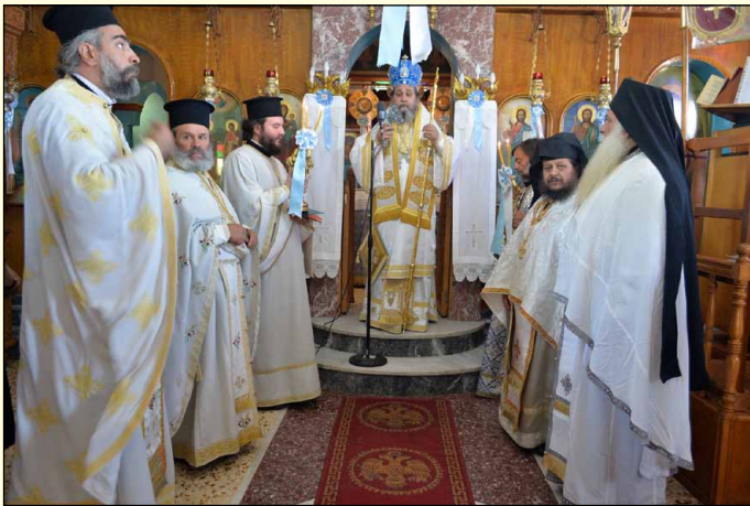
ιερών Άκολουθιών και τής Θ. Λειτουργίας προέστη ὁ Σεβ. Μητροπολίτης Πειραιῶς καί Σαλαμίνος κ. Γερόντιος.