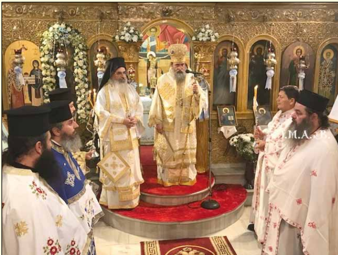
Ἐπίσης, πανηγύρισε καί ὁ ὁμώνυμος Ἱερὸς Ναὸς στὰ ὄρια Ἐλευσίνας-Μάνδρας Ἀττικῆς. Τῶν ἱερῶν Ἀκολουθιῶν προέστη ὁ Σεβ. Μητροπολίτης Ἀττικῆς καί Βοιωτίας κ. Χρυσόστομος, στὴν δὲ Θεία Λειτουργία ἔλαβε μέρος καί ὁ Θεοφ. Ἐπίσκοπος Γαρδικίου κ. Κλήμης.