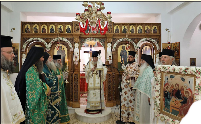
Ο Σεβ. Μητροπολίτης Ώρωπού και Φυλής κ. Κυπριανός τέλεσε την Θεία Λειτουργία στον πανηγυρίζοντα προσκυνηματικό Ναό στην Ίερά Γυναικεία Μονή στις Αφίδνες Αττικής, έκφωνήσας έορτία όμιλία. Έλαβαν μέρος και ο Θεοφ. Έπίσκοπος Μεθώνης κ. Αμβρόσιος, ως και Κληρικοί της τοπικής Μητροπόλεως, παρουσία Μοναζουσών και πλήθους πιστών προσκυνητών.