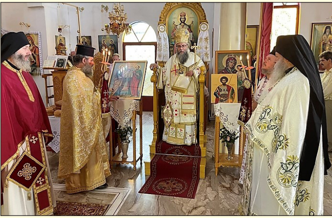
της Πανηγύρεως της Ίερας Γυναικείας Μονής Αγίας Τριάδος Μενδενίτης Φθιώτιδος.