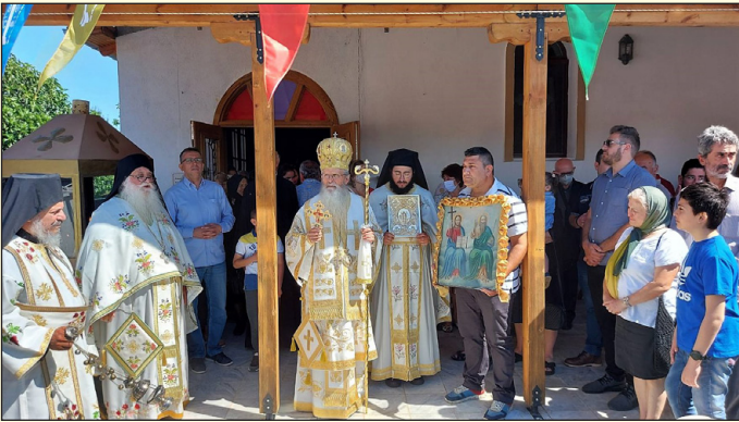
Ο Σεβ. Μητροπολίτης Φιλίππων και Μαρωνείας κ. Αμβρόσιος τέλεσε την Θ. Λειτουργία στον πανηγυρίζοντα Ναό Αγίας Τριάδος στο Βαθυχώριο Κυργίων Δράμας, με τον τοπικό Κλήρο και συμμετοχή πλήθους πιστών.