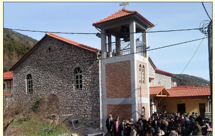
Ὁ σημερινὸς Ἱερὸς Ναὸς τοῦ Εὐαγγελισμοῦ τῆς Θεοτόκου τῆς Ἐκκλησίας μας στὴν Κέρτεζη Καλαβρύτων.