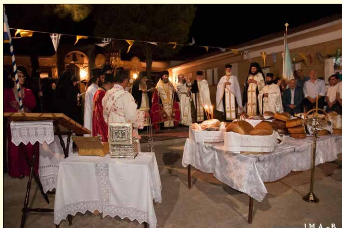
Ἐπίθριος Λιτὴ Μεγάλου Ἑσπερινοῦ Ἁγίας Παρασκευῆς Ἀχαρνῶν Ἀττικῆς, 25.8/7.9.2014.