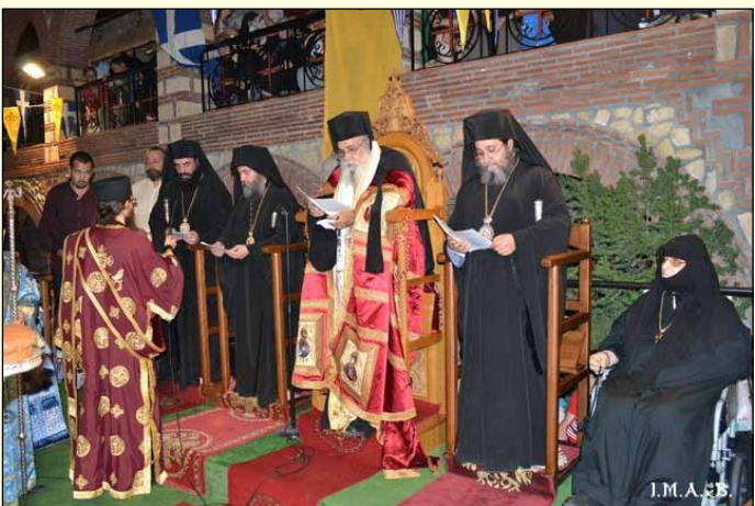
Ἐπίθριος Λιτὴ Μεγάλου Ἑσπερινοῦ Ἁγίας Εἰρήνης Χρυσοβαλάντου Λυκοβρύσεως Ἀττικῆς, 27.8/9.9.2014.