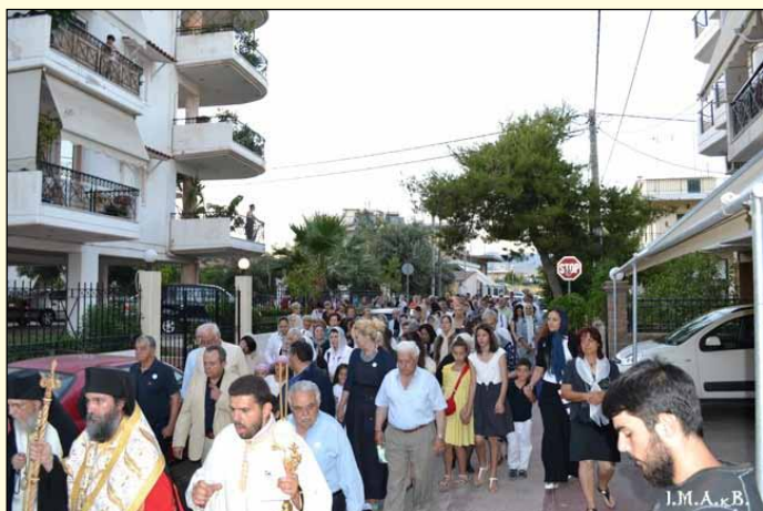
Λιτανεὶα Μεγάλου Ἑσπερινοῦ Ἁγίων Ἀναργύρων Ἐλευσίνος-Μάνδρας Ἀττικῆς, 30.6/13.7.2014.