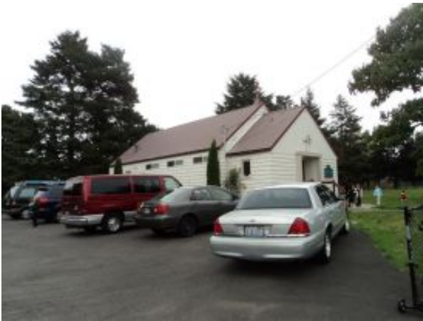
Ὁ Ἱερός Ναός Γενεθλίου τῆς Θεοτόκου Πόρτλαντ Ἡνωμένων Πολιτειῶν Ἀμερικῆς.