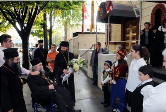
Ἄνω, ἡ ὑποδοχὴ τῶν Ἀρχιερέων εἰς τὸν Καθεδρικὸν Ναὸν Ἀγ. Μαρκέλλης Νέας Ὑόρκης

Ὁ Σεβασμ. Ἀττικῆς καὶ Βοιωτίας κ. Χρυσόστομος μετὰ τοῦ Θεοφιλεστάτου Ἐπισκόπου Μαραθῶνος κ. Φωτίου -ὡς εἶχεν ἀποφασισθεῖ Συνοδικῶς- ἐπρόκειτο νὰ συνοδεύσουν τὸν Μακαριώτατον Ἀρχιεπίσκοπον Ἀθηνῶν κ. Καλλίνικον εἰς Ἀμερικὴν.