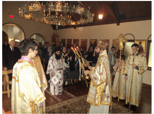
Ἀπό τὸ Ἀρχιερατικὸν συλλεῖτουργον εἰς τὸν Ἱερὸν Ναὸν Τιμίου Προδρόμου Σικάγο.