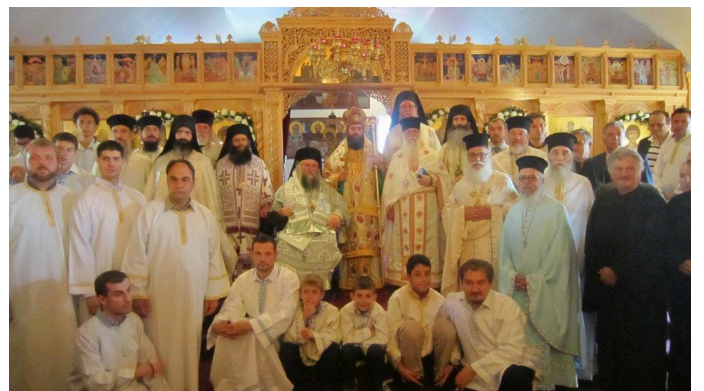
Μετὰ τὸ πέρας τοῦ Ἀρχιερατικοῦ συλλειτουργοῦ εἰς τὸν Ἱερὸν Ναὸν Ἁγίου Νεκταρίου Τορόντο.