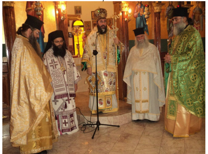
Συλλεῖτουργον εἰς τὸν Ἱερὸν Ναὸν Ἁγίου Νεκταρίου Ντιτρόιτ