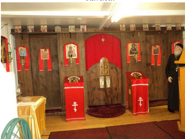
Τὸ παρεκκλήσιον τοῦ Ἁγίου Θεοδώρου τοῦ Ταρσεῶς Ἀρχιεπισκόπου Καντερβουρίας (6 ος αἰ.)