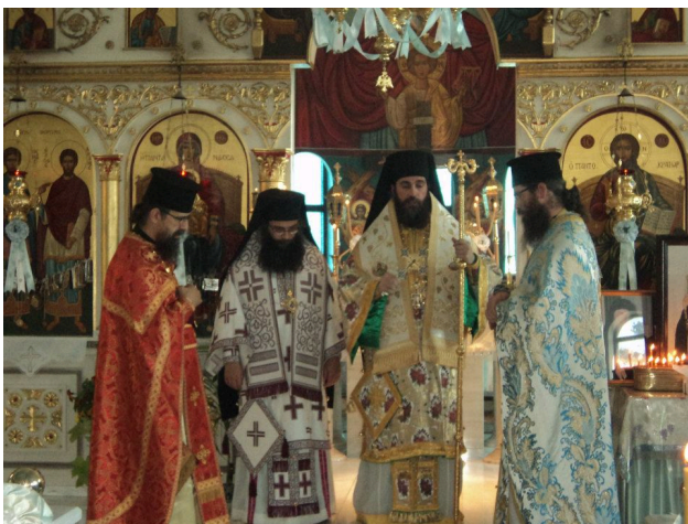
Συλλεῖτουργον εἰς τὸν Ἱερὸν Ναὸν Ἁγίων Ἀναργύρων Σικάγο Η.Π.Α.