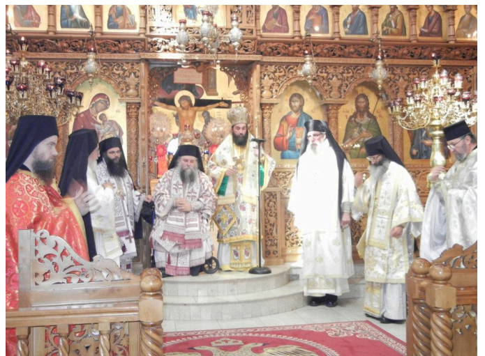
Ἐκ τῆς λειτουργίας εἰς τὸν Καθεδρικὸν Ναὸν Ἀγ. Μαρκέλλης, Ἀστορίας Νέας Ὑόρκης

Ἐγένετο ἀρχιερατικὸν συλλεῖτουργον εἰς τὸν Καθεδρικὸν Ναὸν Ἀγ. Μαρκέλλης, ἐπισκέψεις εἰς ὅλας τὰς Ἱ. Μονὰς (Ἀγ. Συγκλητικῆς Long Island, Ἀναλήψεως τοῦ Κυρίου Woodstock) καὶ τοὺς λοιποὺς Ἱεροὺς Ναοὺς τῆς Πολιτείας τῆς Νέας Ὑόρκης (Ἀγ. Ἰσιδώρου Long Island, Ἀγ. Μαξίμου τοῦ Ὁμολογητοῦ Oweego ὅπου καὶ ἐγένετο λειτουργία).