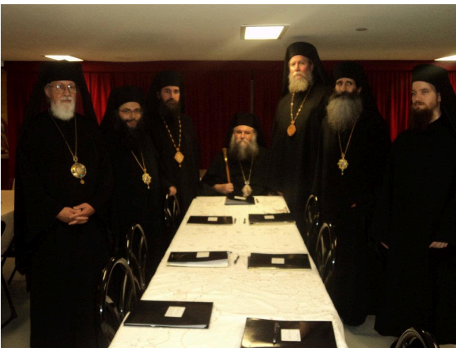
Στιγμιότυπον ἐκ τῆς Συνεδριάσεως τῆς Ἱερᾶς Ἐπαρχιακῆς Συνόδου Ἀμερικῆς. Ἐξ ἄριστερῶν οἱ Ἀρχιερεῖς: Λοχ Λόμοντ Σέργιος, Μαραθῶνος Φώτιος, Ἀττικῆς καὶ Βοιωτίας Χρυσόστομος, Ἀμερικῆς Παῦλος, Πόρτλαντ

Δυστυχῶς, ὁ Μακαριώτατος, λόγω αἰφνιδίου ἀσθενείας δὲν ἠδυνήθη νὰ μεταβῆ, ὅποτε οἱ δύο Ἀρχιερεῖς, ἀπὸ συνοδεία μετεβλήθησαν εἰς ἐκπροσώπους τοῦ Ἀρχιεπισκόπου. Ἐν τούτοις εἰς τὴν συνεδριάσιν τῆς Ἱερᾶς Ἐπαρχιακῆς Συνόδου τὸ Σάββατον 18-9/1-10-2011 μετείχε καὶ ὁ Μακαριώτατος ἐξ ἀποστάσεως μέσω τηλεδιασκέψεως.