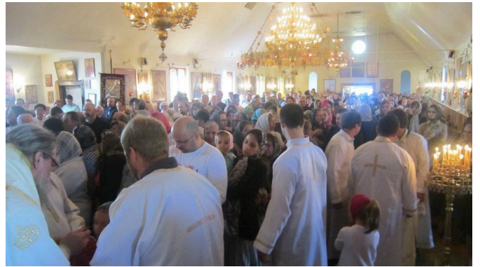
Τὸ ἐσωτερικὸν τοῦ Ἱεροῦ Ναοῦ Ἁγίου Νεκταρίου Τορόντο Καναδᾶ.