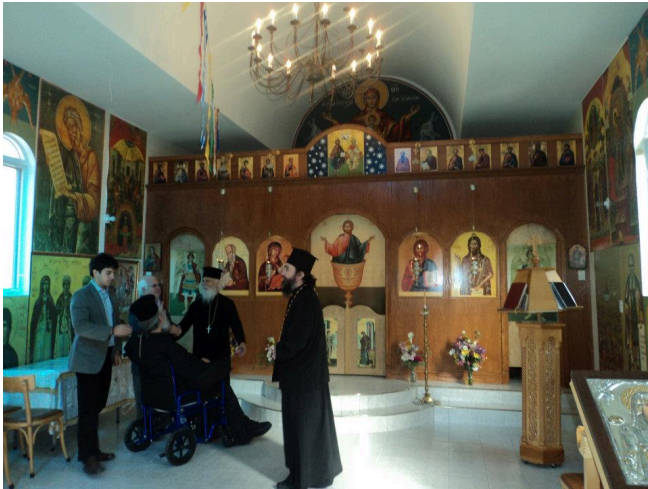
Ἐπίσκεψις εἰς τὴν Ἱερὰν Μονὴν Ἁγίου Ἰωάννου τοῦ Θεολόγου εἰς Μόντρεαλ Καναδᾶ.

Ντιτροϊτ. Εἰς τό Τορόντο ἔλαβε χώραν τριήμερον συνέδριον διὰ τὴν στήριξιν τῶν ἐκεῖ πιστῶν.