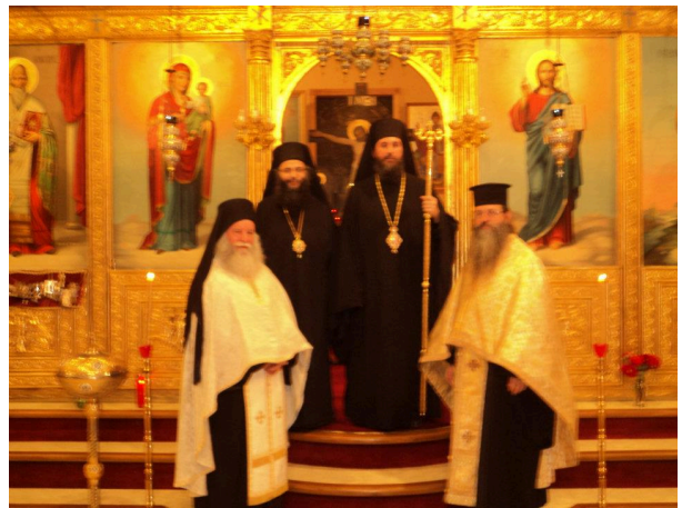
Ἑσπερινὸς εἰς τὸν Ἱερὸν Ναὸν Ἁγίου Σπυρίδωνος Ντιτρόιτ