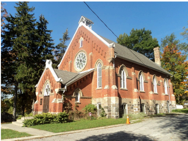
Ὁ Ἱερὸς Ναὸς Ἁγίου Ἰωσήφ τοῦ Μνήστορος εἰς Τορόντο Καναδᾶ.