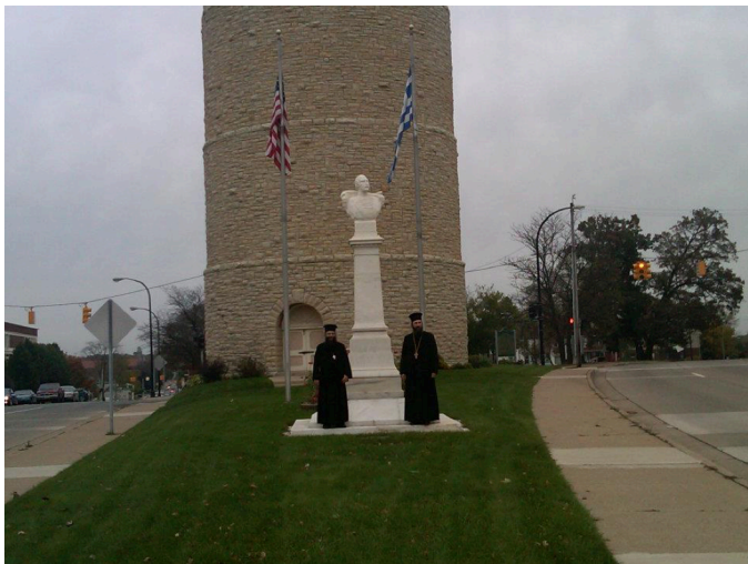
Οί δύο ἐξ Ἑλλάδος Ἀρχιερεῖς εἰς τὸ ἄγαλμα τοῦ Πρίγκηπος Ἀλεξάνδρου Ὑψηλάντου εἰς τὴν πόλιν Ὑψηλάντη πλησίον τοῦ Ντιτρόϊτ, ὀλίγον προ τῆς ἐπιστροφῆς των εἰς τὴν Ἑλλάδα

το οποίο επανεκδόθηκε αναθεωρημένο και συμπληρωμένο το 1828. Στο βιβλίο του ο Νερούλος αναφέρεται με πολλές και ιδιαίτερα σημαντικές λεπτομέρειες στο θέμα της παιδείας και της λειτουργίας των σχολείων στο υπόδουλο Ελληνισμό. Περιγράφοντας την δράση και τα ἔργα του μεγάλου δραγουμάνου και σχολάρχη της Πατριαρχικής Ακαδημίας Αλέξανδρου Μαυροκορδάτου (1641-1709), μεταξύ άλλων αναφέρει τα εξής: