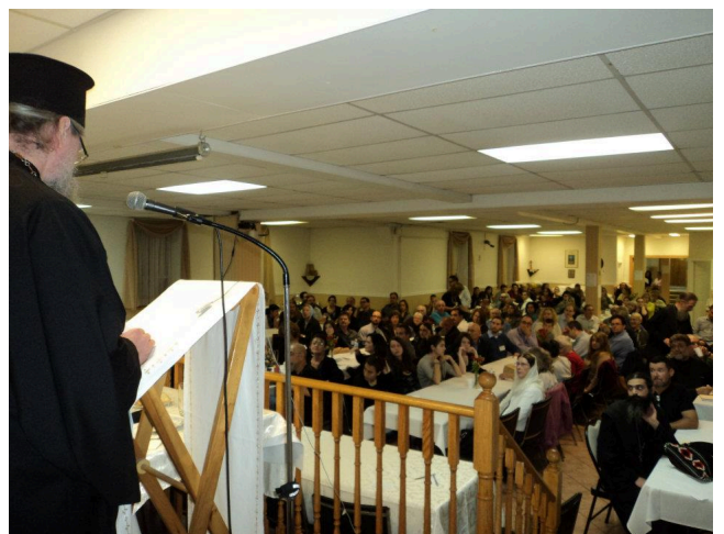
Ἀπὸ τὸ συνέδριον εἰς Τορόντο

Εἰς ἅπαντα τὰ μέρη τὰ ὅποια ἐπεσκέφθησαν ἐγένοντο δεκτοὶ ἐνθέρμως ἀπὸ τοὺς πιστοὺς καὶ ἡ ἐπίσκεψις ἐπέτυχε νὰ συσφίγξῃ τοὺς δεσμοὺς τῶν.