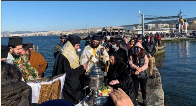
Στὴν Στυλίδα τῆς Φθιώτιδος ὁ Σεβ. Μητροπολίτης

Στὴν Θεσσαλονίκη, ὁ Σεβ. Μητροπολίτης Θεσσαλονίκης κ. Γρηγόριος τέλεσε τὴν Θ. Λειτουργία καὶ τὸν Μέγα Ἀγιασμό στὸν Καθεδρικό Ναὸ τῶν Ἁγίων Τριῶν Ἱεραρχῶν καὶ ἐν συνεχείᾳ, παρόλον ὅτι δὲν ἔγινε ἡ καθιερωμένη πομπή, ὁ Ἀρχιερεὺς μὲ Κληρικούς καὶ πιστοὺς μετέβη στὸν λιμενοβραχίονα τοῦ Ἴστιοπλοϊκοῦ Ὀμίλου Θεσσαλονίκης ὅπου τελέσθη ἡ Κατάδυσις τοῦ Τ. Σταυροῦ πρὸς ἁγιασμό τῶν ὑδάτων.